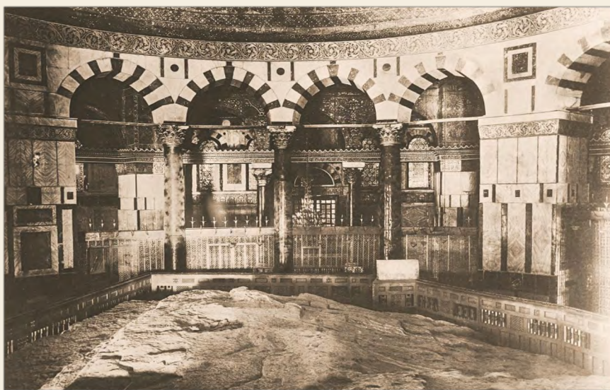
Купол Скалы был построен на Храмовой горе в 692 г. н.э. На этой фотографии показан интерьер 1915 года.

Прибл. 705 от Р.Х.: На Храмовой Горе прямо к югу от Купола над Скалой построена первая Мечеть