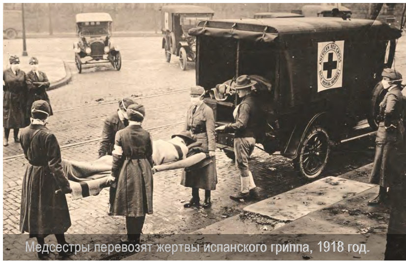
Медсестры перевозят жертвы испанского гриппа, 1918 год.

Некоторые исследователи думают, что вирус гриппа 1918 года сначала мигрировал от птиц к свиньям, прежде распространился среди людей, и