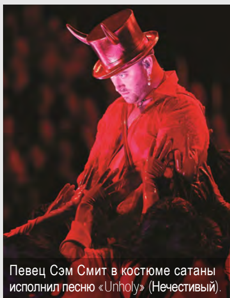
Певец Сэм Смит в костюме сатаны исполнил песню «Unholy» (Нечестивый).

Если у нас есть нужная перспектива и мировоззрение, укorenенные и основанные на Слове Божьем, ответ очевиден. И он прост: мир охвачен злом . Чего же нам следует ожидать , если Бог и Его Слово систематически изгоняются из общественной жизни?