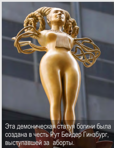
Эта демоническая статуя богини была создана в честь Рут Бейдер Гинзбург, выступавшей за аборт.

стали доминировать в ряде женских видов спорта, а тех, кто протестовал против этого, осуждали как фанатиков и ненавистников. Больницы, фармацевтические компании и врачи обнаружили, что можно делать большие деньги на уродовании гениталий детей и введении им вредных химических веществ, меняющих жизнь.