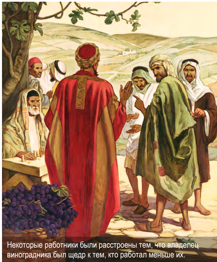
Некоторые работники были расстроены тем, что владелец виноградника был щедр к тем, кто работал меньше их.

Вторым фактором является текучка рабочей силы.